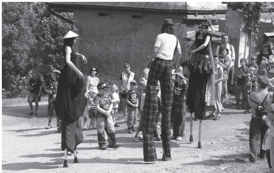
↑↓ DOTEKY 2010 | ↘ Slavnosti babího léta | ↓↓ Maršovská pouť 2010

Opět nezklamalo tradiční vystoupení ochotníků, které tentokrát připomnělo historii nejrůznějších událostí kolem hraničních patníků - počínaje hraničními spory krkonošské šlechty v 17. století až po otevření hranic po vstupu do EU. Živé obrazy v verši doplnila píseň s refrémem „Hranice, hranice nad Maršovem vedou, cestičku hraniční kameny lemují...“